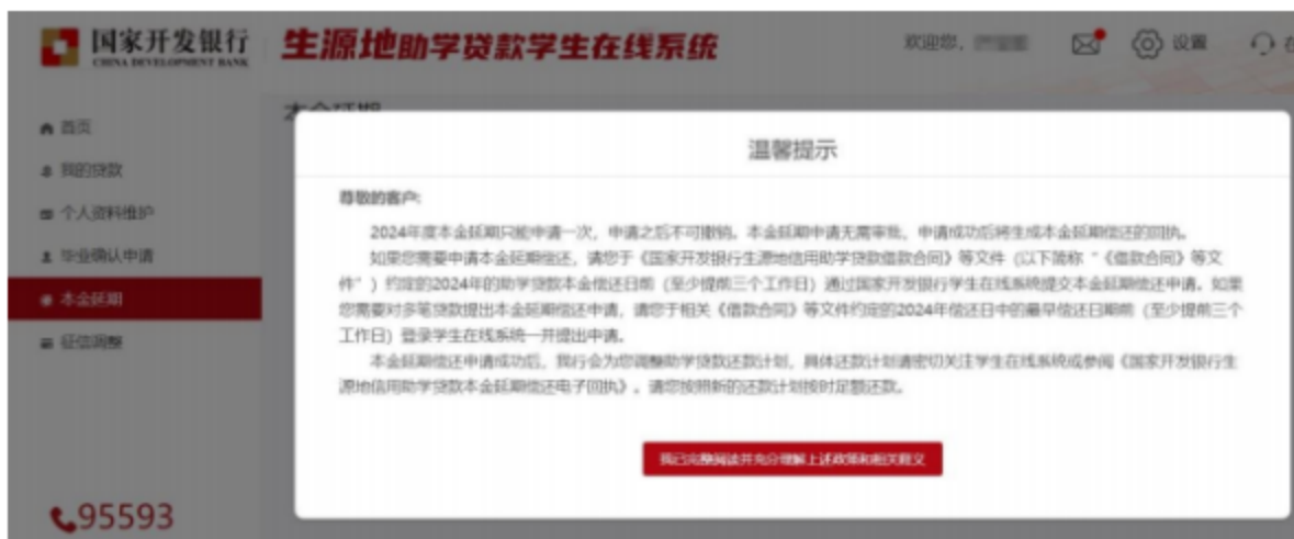
①本金延期-菜单列-政策提示弹框

1. 登陆学生在线系统，点击菜单列“ 本金延期 ”，弹框政策提示弹框，提示框下方设置按钮“ 我已完整阅读并充分理解上述政策和相关释义 ”（图①）“ 已申请延期合同 ”信息为上一年度申请的延期合同；