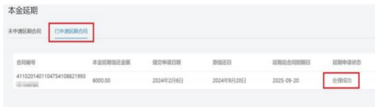
⑤ 本金延期-已申请延期合同

5. 跳转展示已申请延期合同列表（提交成功后，“延期申请状态”为“申请中”，重新登录系统或刷新网页转变为“处理成功”）（图⑤）；