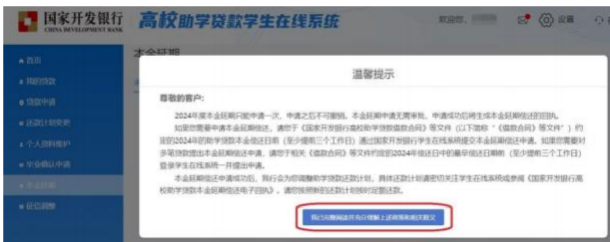
①本金延期-菜单列-政策提示弹框

1. 登陆高校助学贷款系统，点击菜单列“本金延期”，弹框政策提示弹框，点击提示框下方按钮“我已完整阅读并充分理解上述政策和相关释义”进入下一步（图①）；